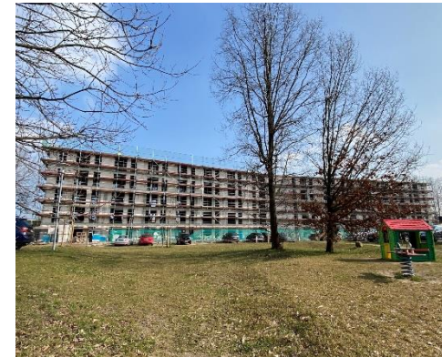
Haus 11 – Blick vom Spielplatz bei Haus 2