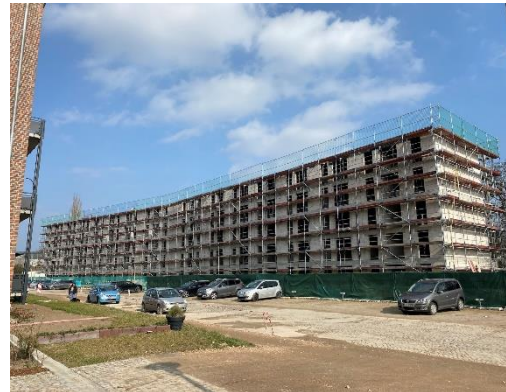
Haus 11 – Ansicht von der Einfahrt aus

Aus Versicherungs- und Haftungsgründen ist eine Begehung der Baustelle ohne vorherige Anmeldung, ohne entsprechender Sicherheitskleidung sowie der Begleitung eines Mitarbeiters von uns vor Ort, strengstens untersagt. Um einen sicheren und reibungslosen Bauablauf zu gewährleisten, ist es daher zwingend erforderlich, uns sämtliche Vor-Ort-Termine mind. 48 Stunden im Vorfeld anzuzeigen, damit wir die Koordination übernehmen können. Die Bauleitung ist angewiesen, unangemeldete Gäste der Baustelle zu verweisen!