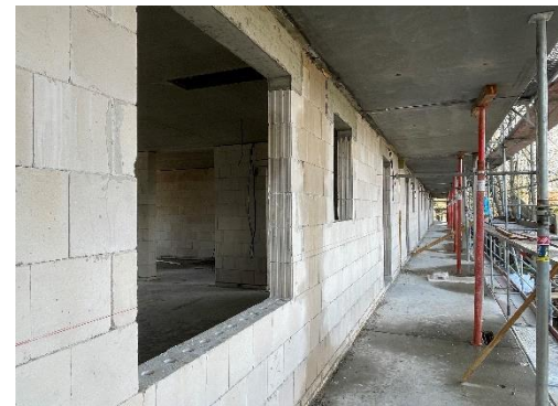
Haus 11 – Eingangsseite